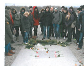
Weimar- Buchenwald 2012