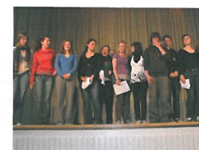
Spectacle de Slam, Kevelaer 2008